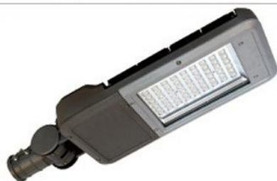
GEO-Technik LS-111 LED Street Light 60W